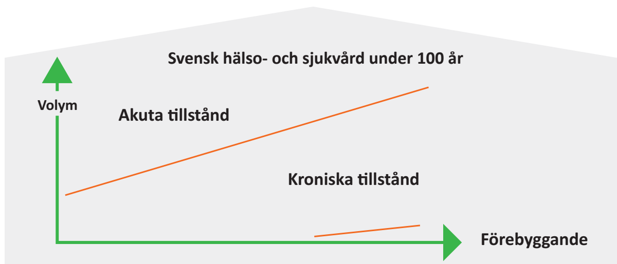
Figur 1. Utveckling av behovet av hälso- och sjukvård från 1900-talet och fram till 2020.

Behovet av vård har dock redan ändrats. Den medicintekniska utvecklingen gör att vi lever allt längre och kan leva med sjukdomar som tidigare ledde till tillfrisknande eller död, exempelvis cancer. Utöver det har människors sätt att leva förändrats och i dess spår också gett upphov till att andra sjukdomar ökat. Stillasittande, minskad fysisk och social aktivitet, ökat välstånd och tillgång till mat, socioekonomisk status, rökning och alkoholinlag är alla faktorer som påverkar människors hälsotillstånd. Diabetes, hjärt- och kärlsjukdomar, psykisk ohälsa är några sjukdomar som ökat till följd av människors livssituation i dagens samhälle. På det hela har andelen kroniska sjukdomar av det totala vårdbehovet ökat markant och tycks fortsätta göra. (se figur 1).